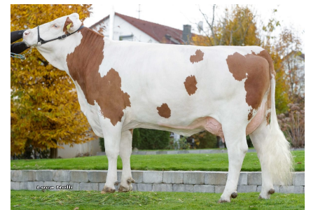
GANDA DE 09 51371140