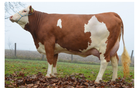
HYPE DE 09 54061464